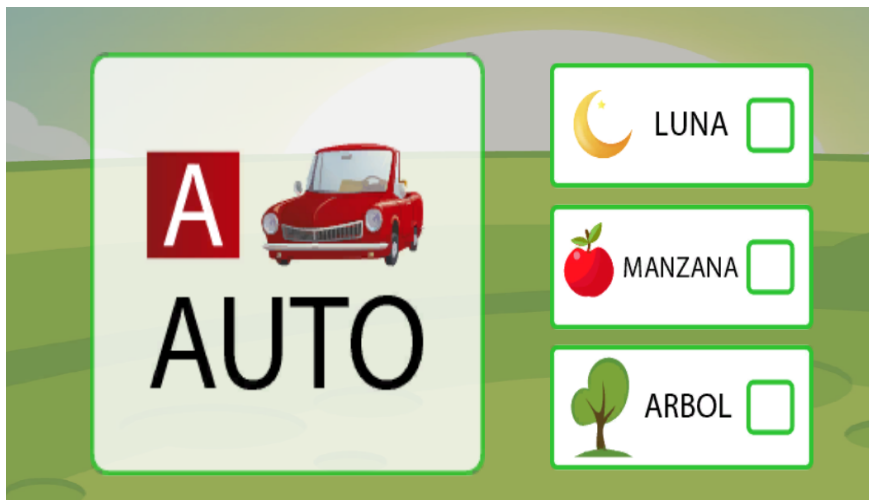
Figura 3. Ejemplo de visualización del nivel A.

La actividad se centra en la identificación y correspondencia entre el aspecto fonológico y gráfico de las letras vocales para luego reconocer a la misma en el inicio de una palabra. Esta presentación de la letra se realiza en un contexto significativo, y no de modo aislado donde se estereotipe al conocimiento así como también al usuario. De este modo se tuvieron en cuenta los intereses del grupo tanto en relación a los textos como a las imágenes que los acompañan. El joven tiene a la vista opciones que le permiten guiar su elección de la vocal correcta, pudiendo realizar la selección con el mouse o escribiendo la vocal directamente con el teclado. La siguiente figura ilustra esta actividad: